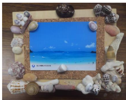
貝殻フォトフレーム作り