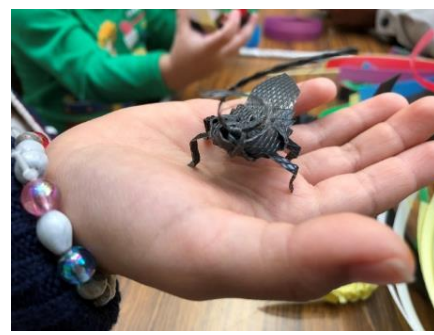
PPバンドおもちゃ作り

※その他、どんぐり工作、バルーンアート、ビュンビュンごま作り等、多彩な体験ブースを用意しております。