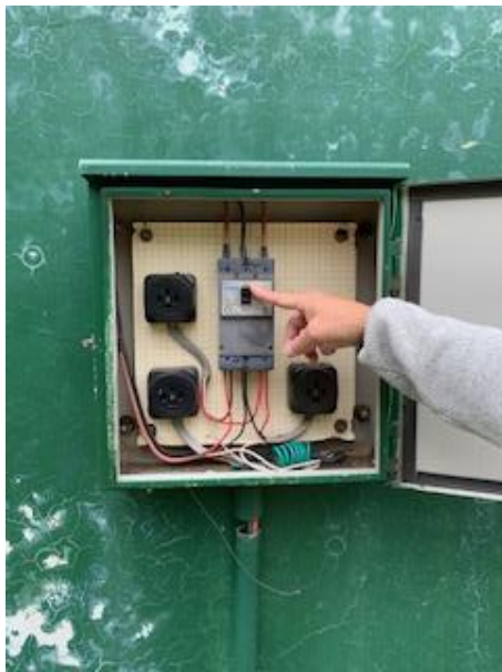
コンセント (200V 用)