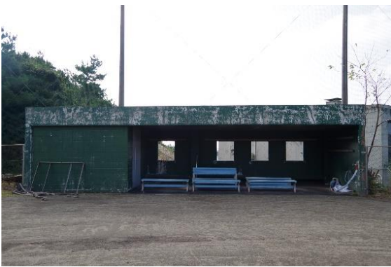
ベンチ 3 塁側