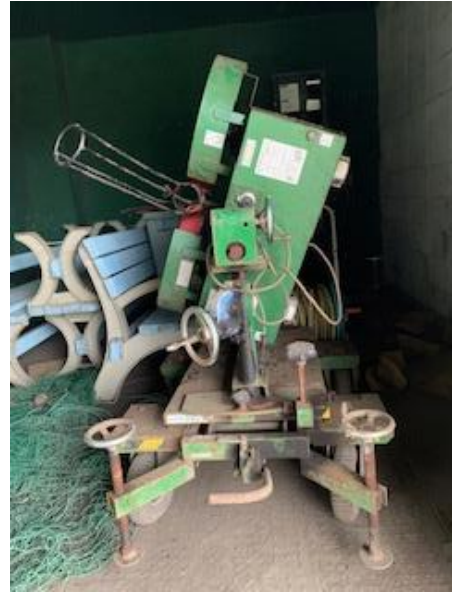
ピッチングマシーン (200V 用)