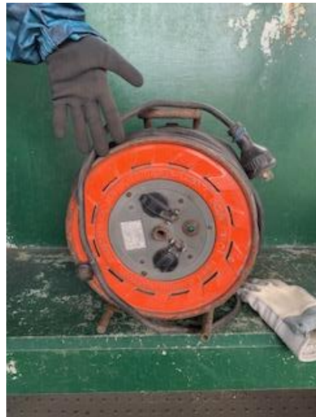
延長コード (200V 用)