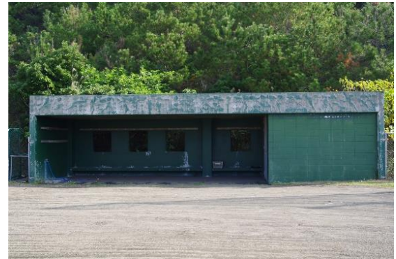
ベンチ 1 塁側