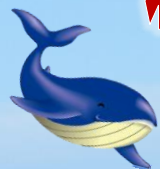
とかしきーケラ丸くん