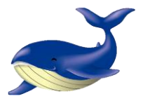
とかしきークラ丸くん