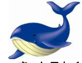
とかしきーケラ丸くん