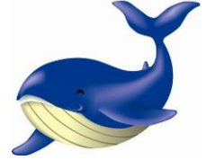
とかしきーケラ丸くん