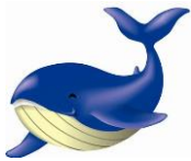
とかしっきーケラ丸くん