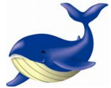
とかしきーケラ丸くん