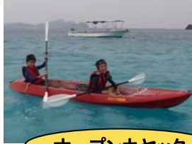
オープンカヤック