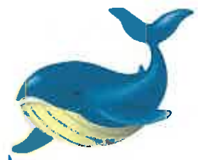
とかしっきーケラ丸くん