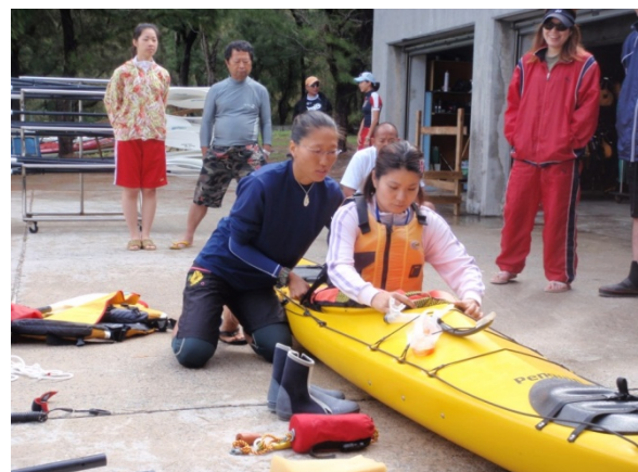
【シーカヤックの指導方法】