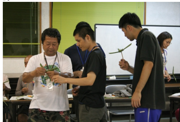
【あだん葉での風車づくり】

アンケートなどからも見て取れるように参加者は今後のそれぞれの活動や仕事などにも活かしていきたいとの声も多く所期の目的は達成する事ができた。