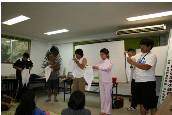
【三角巾での救急法】